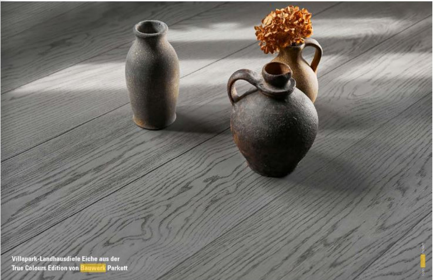
Villapark-Landhausdiele Eiche aus der True Colours Edition von Bauwerk Parkett