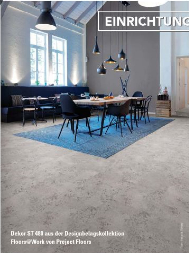
Dekor ST 480 aus der Designbelagskollektion Floors@Work von Project Floors