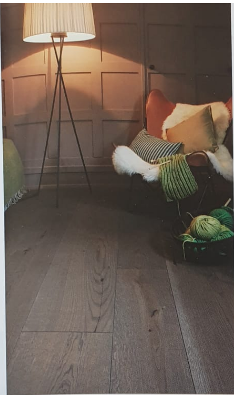
Die Breiten variieren zwischen 200 und 395 mm, die Längen zwischen 2.000 und 4.000 mm. Eiche Fumo.