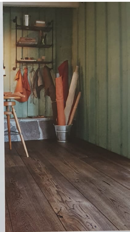
Für die drei Handcrafted-Varianten werden die Böden manuell bearbeitet. Eiche Fulvo Handcrafted.

aus Eiche, die Mittellage aus Kiefer, die Unterlage aus Fichte/Tanne; alle Hölzer stammen aus kontrollierter Herkunft. Die Oberfläche ist naturgeölt. Jedes Element sei handverlesen, wird in St. Margrethen betont, die natürlichen Charakteristika des Holzes würden sorgfältig herausgearbeitet.