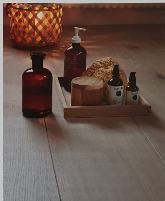
Die Dreischicht-Elemente stehen in acht ausgesuchten Farben zur Auswahl. Eiche Farina.

Die dreischichtigen Dielen werden in fünf Breiten – 200, 250, 300, 350 und 395 mm – und Längen zwischen 2.000 und 4.000 mm gefertigt. Die Deckschicht besteht