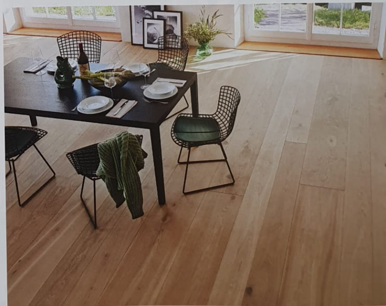
Eiche Avorio ist auch auch in Handcrafted-Ausführung erhältlich.

mehrschichtige Farbtechnologie „Next“ den einzelnen Colorits eine faszinierende, dreidimensionale Tiefenwirkung. Die bisherigen Erdtöne wurden mit zwei modernen, stilvollen Graustufen ergänzt: Nuvola ist hell, puristisch, urban, Roccia, etwas dunkler gehalten, strahlt Ruhe und Beständigkeit aus.